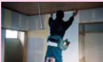
クロス貼り作業中!!

職人さんがコテを使い下塗り、上塗り回数に分けて乾燥具合を見ながら時間を掛けて仕上げていきます。最近では、和室が少なくなり塗り壁の仕上りも減って来ています。玄関やポーチのタイル貼りの仕上りも左官屋さんの仕事です。