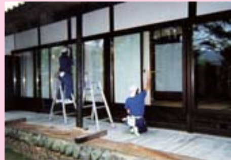
◀ 竣工クリーニング中