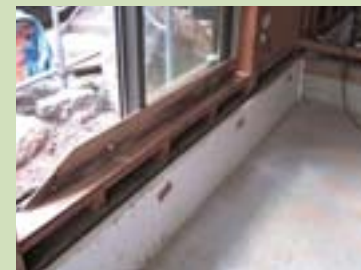
基礎断熱ウレタンボード張り