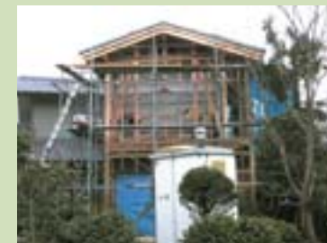
内外仕上材等撤去