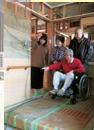
◀ 手摺り取付位置確認(取付位置も個々に対応)