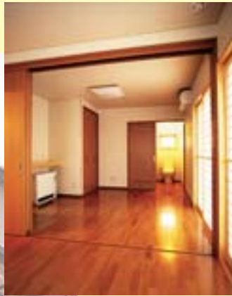
◀ 寝室にも専用トイレ

O様の「憩い」造りのお手伝いを精一杯させて頂きました。協力業者と共に、これからも永くお付き合いさせて頂きたいと思っております。大変ありがとうございました。