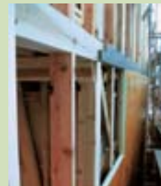
外壁断熱ウレタンボード張り