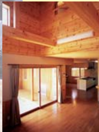
▲大空間の吹き抜け