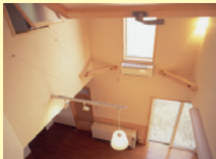
2階からも見下ろせる広々空間のLDK

完成し引越するまでに何度も足を運んで細かな要望も聞いていただいた工務店さんには本当に感謝しています。