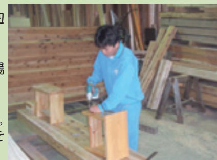
記念に踏み台作り