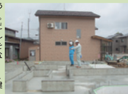
基礎工事現場見学中

学校生活から離れてみての職場体験学習は、普段接することの無い道具や環境の中でしたので、目の前の事に精一杯かと思っておりましたが、質問の答えを聞いて、慣れない状況の中でも細かい部分にも目を向けていることに、とても感心しました。このように様々な事に興味を示し、この日の出来事がいつか役立ち実となるのが、私達の願いです。