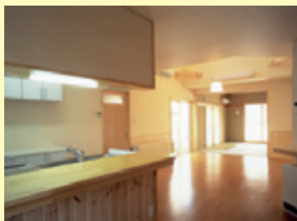
家族で集える明るい空間