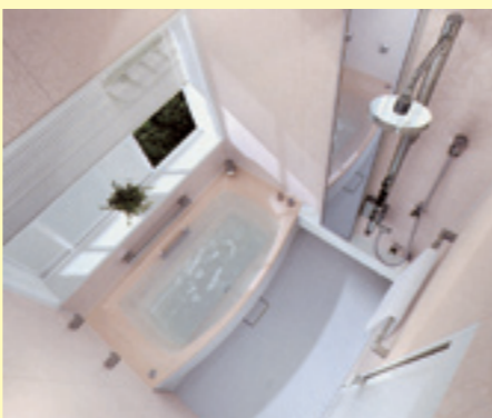
シャワーバータイプ