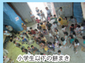
小学生以下の餅まき

当日の収益金 41,600 円は市の社会福祉協議会に寄付させていただきました。当日参加して下さった皆様、大変有難うございました。