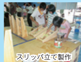
スリッパ立て製作