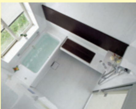
ベンチカウンタータイプ