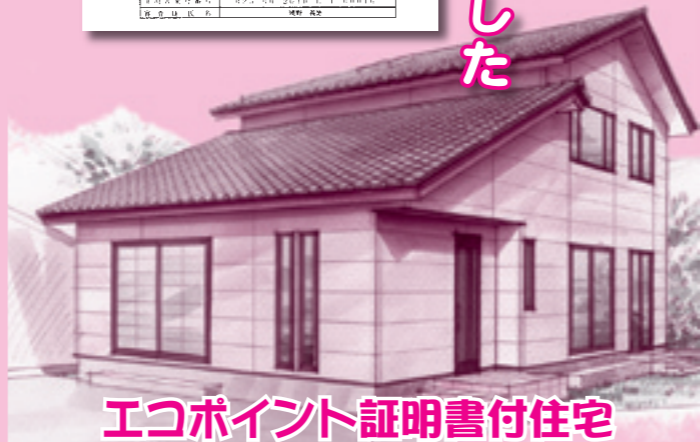
エコポイント証明書付住宅